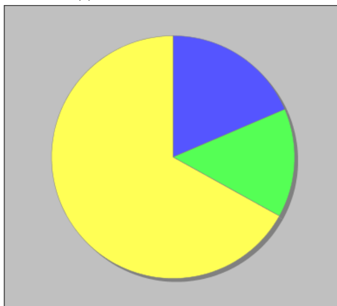
Distribuzione dei docenti a T.I. per anzianità nel ruolo di appartenenza (riferita all'ultimo ruolo)